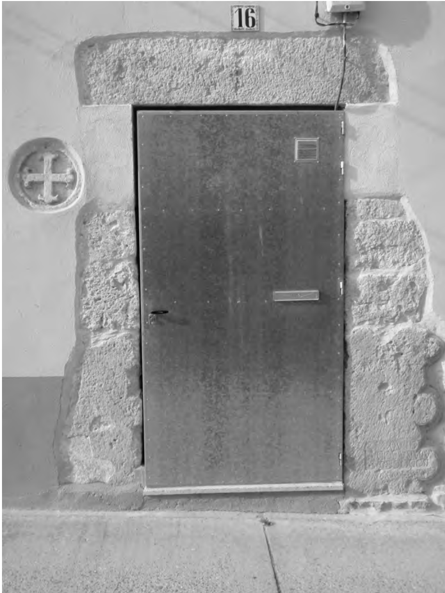
Fig. 1. Estela de Bodogenus en su actual localización en Padilla de Duero.

biera adquirido —probablemente en el extranjero, dada la falta de paralelos en Hispania— una lápida romana lujosa y ya adornada con un elegante marco festoneado para luego hacerla grabar para dos difuntos según un esquema organiza-