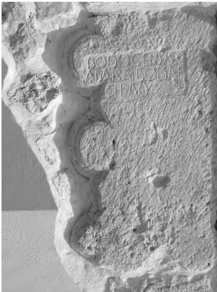
Fig. 2. La estela en su posición correcta.

tivo bastante frecuente en ámbito indígena 2 ; los epígrafes se habrían colocado entonces en el sector izquierdo y, respectivamente, derecho del espacio superior de la estela delimitado por el marco monumental de tipo barroco, inscribiéndose por lo tanto cada uno en un espacio rectangular rebajado. La presencia de dicha car-