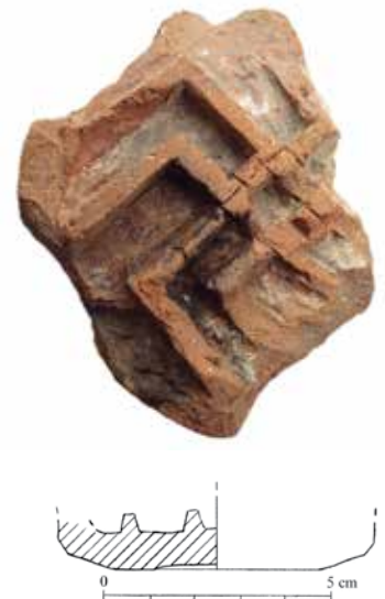
Fragmento de Cauca .

De su morfología nada podemos decir con seguridad. Por paralelismos de los que seguidamente hablaremos, lo más probable es que estemos ante una forma semiabierta, de tipo cuenco profundo con la base plana o de marmita