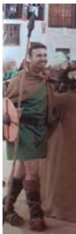
El alcalde de Peñafiel con disfraz de vacceo, en el Desfile de la Historia , Peñafiel, 2017 (detalle del cartel publicitario).