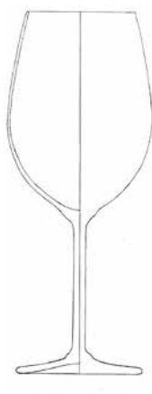
Sección de una copa industrial.

englobaría los errores debidos a que la pieza es artesana y la manipulación del alfarero puede hacer que la pieza no sea de revolución perfecta, junto con las posibles deformaciones a causa de haber estado enterrada durante dos mil años o más. Cuando el dibujante toma la pieza artesana y dibuja su sección, si la pieza no es muy irregular el principal error será el que cometa con el conjunto discreto de medidas que tome; pero si además la pieza está bastante deformada, dependiendo del ángulo que considere para hacer la sección, puede haber bastante diferencia entre una sección y otra. Estos errores asociados al dibujo de la sección son los que denotaremos como |V_{SR} - V_{SD}| . Por último, cuando se pretende calcular el volumen de la pieza mediante el método de integración numérica descrito, usando la sección de la que se dispone, se pueden cometer errores al medir los radios y los errores de la propia fórmula de cuadratura, lo corresponde a |V_{SD} - V_{IN}| .