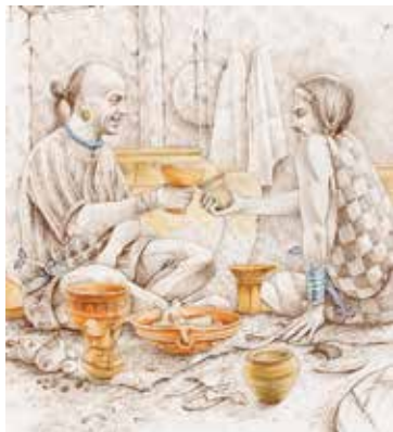
Reconstrucción de un ágape con el ajuar doméstico procedente de la estancia del banquete. Dibujo: Luis Pascual Repiso-CEVFW.

El uso de sistemas métricos estandarizados se inició con las antiguas civilizaciones por la necesidad de medir de forma comparable y permitir, entre otras cosas, la expansión del comercio, por ejemplo reconociendo una unidad de volumen para la venta de vino o aceite. Se cree que las primeras unidades en la zona del mar Egeo fueron tomadas de Egipto, aunque fueron variando según las ciudades, hasta la reforma del sistema griego de Solón, en el año 594 a.C., en la que se fijaron los patrones de Egina para el volumen (Pellicer, 1997). Dentro de las unidades de capacidad en el sistema griego destacamos la cótila , que corresponde a 0,283 litros y que era utilizada tanto para áridos como para líquidos. Puede considerarse la cótila como ración individual de consumo y sus múltiplos otras unidades normalizadas, como por ejemplo sextario (2 cótilas ), quénice (4 cótilas ), hemichoos (6 cótilas ), khous y xous (12 cótilas ), hemiecton (16 cótilas ), hekteis (32 cótilas ), ánfora (72 cótilas ), metreta (144 cótilas ) y mediano (192 cótilas ).