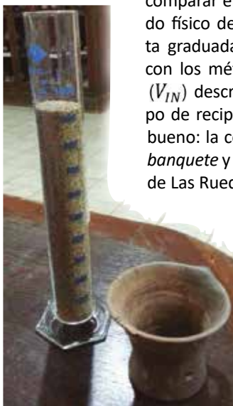
Probeta con las semillas correspondientes al llenado de la jarra de la estancia del banquete .

Para validar el método proponemos comparar el volumen medido con el método físico de llenado con semillas y probeta graduada ( V_S ) y el volumen calculado con los métodos de integración numérica ( V_{IN} ) descritos previamente, para un grupo de recipientes en estado relativamente bueno: la copa y la jarra de la estancia del banquete y otras seis copas de la necrópolis de Las Ruedas. Precisamente, en la imagen de la izquierda se refleja la medida con semillas de la capacidad de la jarra del banquete .