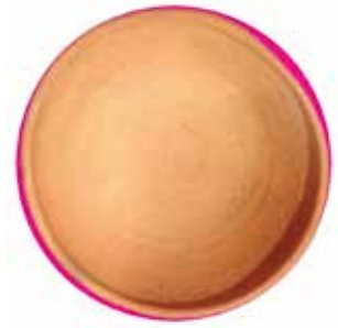
Vista cenital de la copa LR128_K inscrita en un círculo.

Como se puede ver, la pieza LR128_K es la que obtiene la peor aproximación con un error relativo del 45%. En la foto cenital de dicha pieza se observa claramente la deformación de la copa, especialmente en el cuarto superior derecho. Probablemente la sección de esta pieza se ha hecho desde algún ángulo de esa zona con un radio menor, por lo cual el volumen calculado con la sección queda por debajo del volumen medido físicamente con semillas.