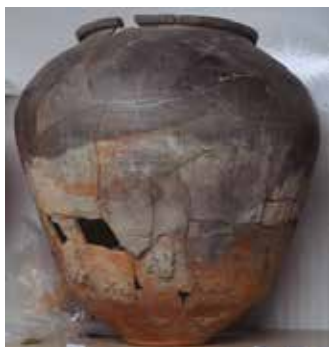
Dolium de la estancia del banquete.

Nos centraremos en el estudio de la cerámica del yacimiento vacceo de Pintia , de Padilla de Duero, situada a cuatro kilómetros de Peñafiel. Prestaremos especial atención a los materiales encontrados en 2003 dentro de la llamada estancia del