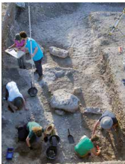
Durante la excavación en el sector F1h10.

Fuera del contexto en el que ha sido recuperado, el cuenco con botones de bronce de paredes gruesas, intenso bruñido y cierta tendencia globular movería a pensar en un recipiente de mayor antigüedad. En la necrópolis de Las Ruedas este tipo de decoración resulta excepcional, aunque su asociación en un minúsculo fragmento a peine inciso parece encajar en la práctica decorativa de una barroca decoración que combina diversas técnicas, característica de la plenitud de la segunda Edad del Hierro (sobre todo en los ámbitos vetón y vacceo). Sin embargo, sorprende la sobriedad de la nueva pieza que parecería encajar en un horizonte previo, ya que la práctica decorativa de incrustar grapas