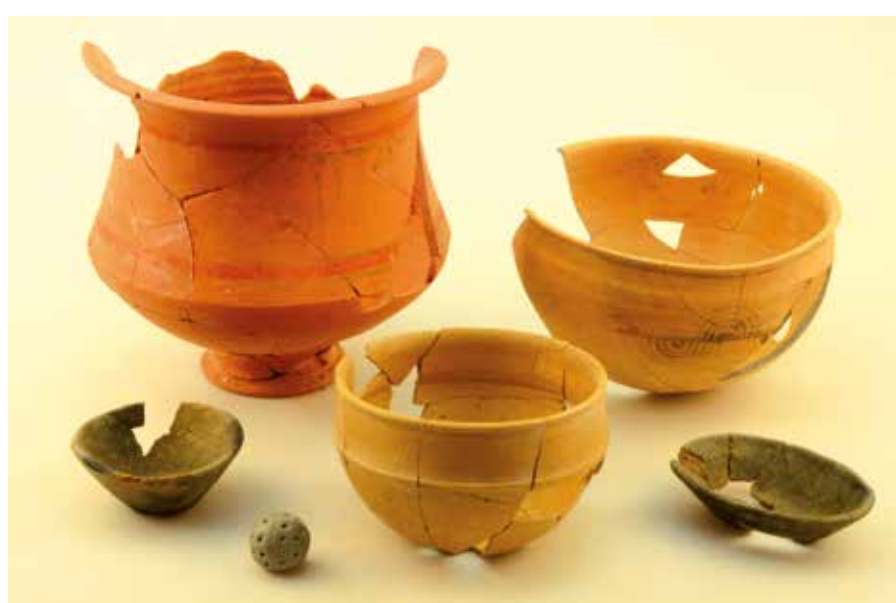
Materiales de la tumba 307 una vez restaurados.

Concluimos señalando la baja densidad de enterramientos y la posibilidad, ya apuntada en la campaña de 2016, de que nos encontremos en una zona intermedia, de transición entre las diferentes áreas en que pudiera organizarse el cementerio. Sólo la acometida de nuevos trabajos permitirá arrojar luz sobre el particular.