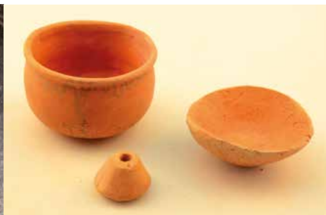
Tumba 306 in situ y materiales una vez restaurados.

nalado mucho más sutil o superficial, lo que parece un zoomorfo en perspectiva cenital incompleto como consecuencia de la fractura de la pieza.