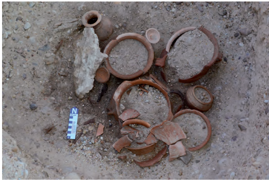
Tumba 302 in situ , en diversos momentos de su excavación.

tella. Todos estos recipientes presentan restos de pintura que el ambiente de humedad extrema ha reducido a una mínima expresión. Por último, de la botella señalada cabe destacar que posee un tratamiento impermeabilizante, ya que apareció llena por completo de agua en el momento de su excavación, sin ningún sedimento interior merced a un canto que taponaba su boca, y en su interior pudo recuperarse, en perfecto estado de conservación, una semilla de bellota, lo que ofrece un interés añadido desde un punto de vista simbólico. Recuérdese cómo, por ejemplo, en el siglo XIX en la Baja Bretaña, Anatole le Braz recogía los testimonios orales sobre el Anaon, la masa inmensa de ánimas en pena, y señalaba que: “ certaines âmes sont condamnées à faire pénitence jusqu’à ce qu’un gland, ramassé le jour