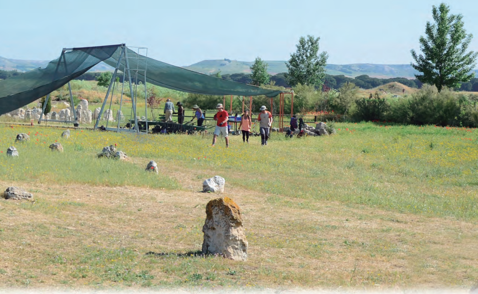
Concentración de estelas en los sectores F1g8 y F1h8.

Con previsiones de futuro se abrió una larga trinchera de dieciséis sectores de excavación en las cuadrículas F1 y F2, delimitados al norte por las intervenciones de 2013 (F1) y 2007-08 (F2) y al oeste por la Zanja II (1985-87), al tiempo que se dejaron libres de excavación los sectores “i”, tanto de F2 como F1, para facilitar el desplazamiento de una de las patas de apoyo de la estructura bípode sustentadora de la malla sombreadora. Previamente a la intervención arqueológica se procedió a eliminar con medios mecánicos la capa correspondiente a la canalización del arroyo de La Vega, cuyos limos compactos y grisáceos fueron extendidos en 1984 por la superficie de la necrópolis. Finalmente se cercó el área y