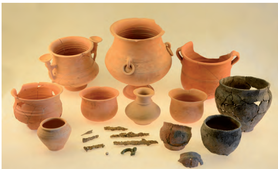
Materiales de la tumba 302 una vez restaurados.

Finalmente cabe referirse a la restauración de la zona excavada durante los años 2014 y 2015, con el procedimiento habitual de relleno de la superficie excavada, plantación de árboles, restitución de las estelas a su lugar de origen de manera enhiesta y sellado superficial en gravas.