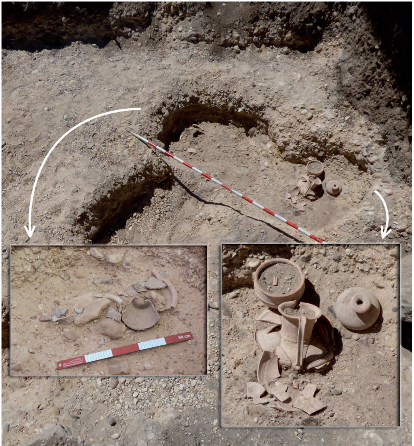
Tumba 298 in situ .

una orientación norte-sur. De esta posible tumba doble quedaron preservados los objetos más extremos pegados a los perfiles abruptos norte y sur del loculus , de manera que la parte media del mismo se vio afectada por la posterior excavación del hoyo de la tumba 302.