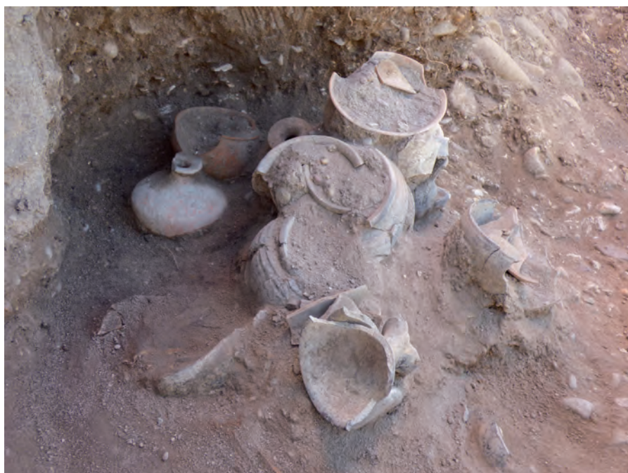
Tumba 300 in situ .

El estado de conservación de los conjuntos no es particularmente bueno, ya que a excepción de 300 y 302, todos los demás parecen haber sufrido alteraciones más o menos intensas. Nos referiremos en concreto a la tumba 298 detectada en un gran hoyo de 150 por 90 cm, que interesaba a la terraza estéril en 120 cm, cuyo eje mayor mostraba