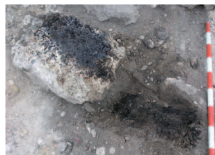
Mancha de quema ritual (?) bajo una piedra caliza, necrópolis de Las Ruedas.

bustión, probablemente resultado de la quema de resinas, testimoniadas en las sepulturas 190, 195, 205, 208 y 213, que aportan un valor añadido a la riqueza material de las mismas. No obstante, debe llamarse la atención sobre el hecho de que un número elevado de estelas calizas presentarían en su superficie de contacto con los hoyos de las tumbas señales muy claras de rubefacción. Tal circunstancia podría ponerse en relación con el ritual arriba indicado, con lo que nos encontraríamos ante un sistema de cierre de la tumba mediante grandes estelas concebidas, por tanto, no para ser vistas en superficie, sino para el sellado del conjunto —proceder excepcional observado hace tiempo en conjuntos como el 54—. Otra posibilidad de interpretación pasaría por considerar que dichas estelas hubieran estado inicial-