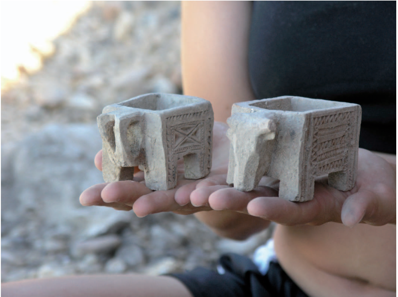
Pareja de cajitas zoomorfas, ejecutadas en técnica incisa y excisa, recién exhumadas, procedentes de la tumba 199 de Las Ruedas, siglos II-I a.C.

tima campaña y en siete tumbas —185, 187, 195, 201, 205, 210 y 211—, un nuevo tipo denominado puñal de filos curvos o también de tipo Villanueva de Teba y La Osera, muy común en yacimientos autrigones y en menor medida vettones, que presenta una cronología