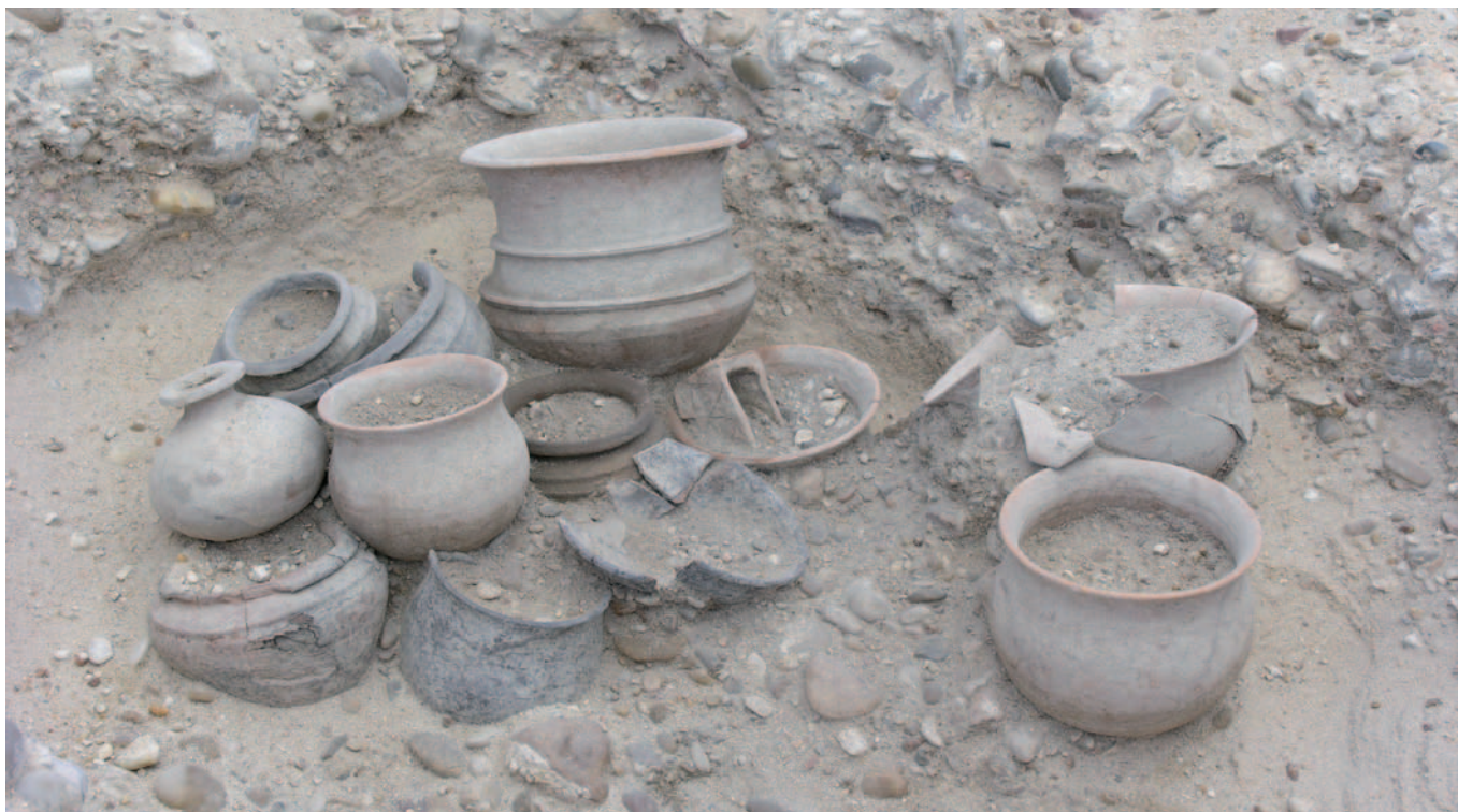
Tumba 183 in situ de la necrópolis de Las Ruedas, siglos II-I a.C.

de la comparecencia de determinado tipo de elementos en los ajuares. Así, la aparición de panoplia y objetos de aseo personal permitirían definir identidades masculinas; precisamente, en esta campaña ha sido muy significativa la presencia de tumbas con armamento —184, 185, 187, 195, 197, 201, 205, 209, 210, 211, 212 y 223— las cuales, en su mayoría, cuentan con una punta de lanza. También podrían incluirse en el grupo de varones los conjuntos 198 y 220, que contienen pinzas y navaja, en el caso del primero, y navaja, en el segundo.