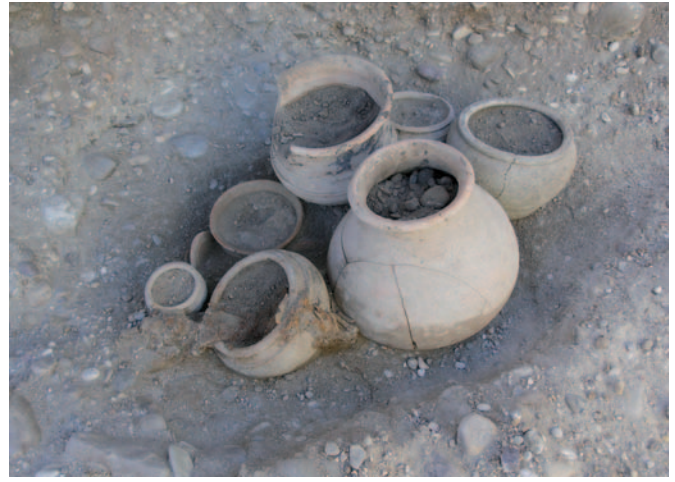
Tumba 195 de la necrópolis de Las Ruedas, también con un puñal de filos curvos entre sus ajuares, siglos II-I a.C.