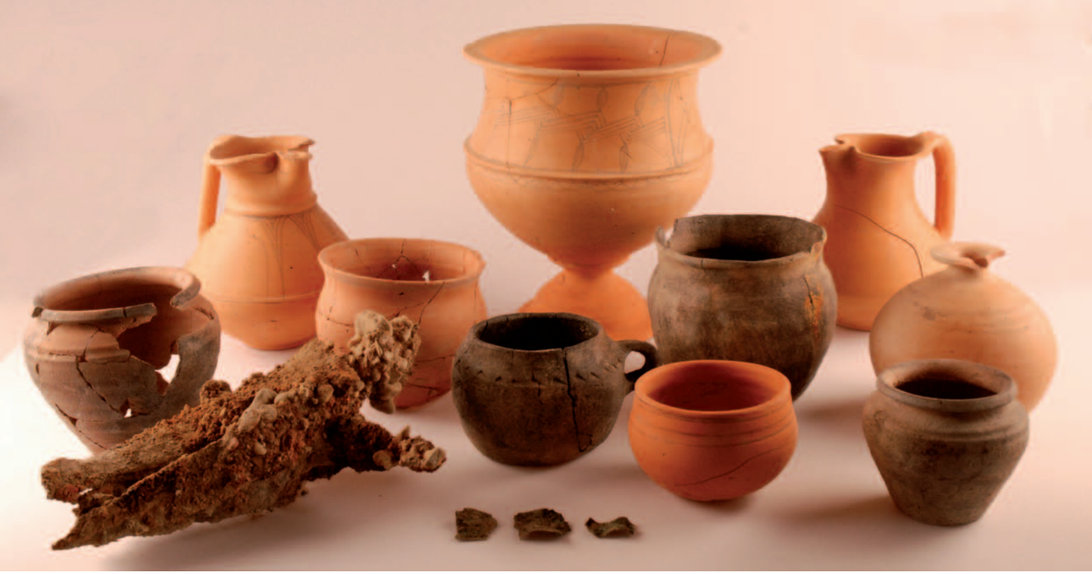
Tumba 185, necrópolis de Las Ruedas, siglos II-I a.C., con diversas producciones cerámicas; en primer plano, un puñal de filos curvos todavía por restaurar.

caso del ejemplar de la tumba 195—, y los hombros de la hoja levantados formando ángulo recto con la espiga, de sección rectangular. Sobre ésta se montaría la empuñadura compuesta por tres elementos claramente diferenciados: guarda, puño y pomo que remataría en una pequeña virola de forma variable —de cuerpo cónico, semicircular, esférica, con casquete semiesférico, etc.—. Estos tres elementos, cuando no hechos en material orgánico, están realizados con láminas metálicas en bronce —anverso— y en hierro —reverso—, unidas por pernos fijados a la espiga mediante presión, ayudados por un material de naturaleza orgánica, ya sea madera o hueso.