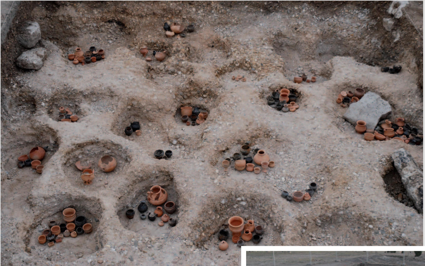
Reposición de algunas de las tumbas exhumadas, una vez restaurados sus materiales, en los hoyos donde fueron descubiertas.

La alta densidad de grandes estelas calizas localizadas en este sector de la necrópolis propició una conservación inusualmente favorable de las tumbas.