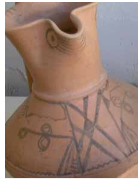
▲ Detalle de la jarra de la tumba 128.

◀ Productos singulares de la tumba 127b: sonajero y cajita excisos y, en primer término, dos trompetas miniaturizadas similares a las de tipo numantino .