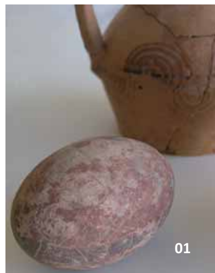
01 Huevo pintado de oca, encontrado en la tumba 127b.

La zona de mayor densidad de hallazgos se ha localizado en los sectores más septentrionales, correspondientes a cronologías avanzadas, en torno a las guerras sertorianas (75 a.C.). Entre las numerosas tumbas obtenidas