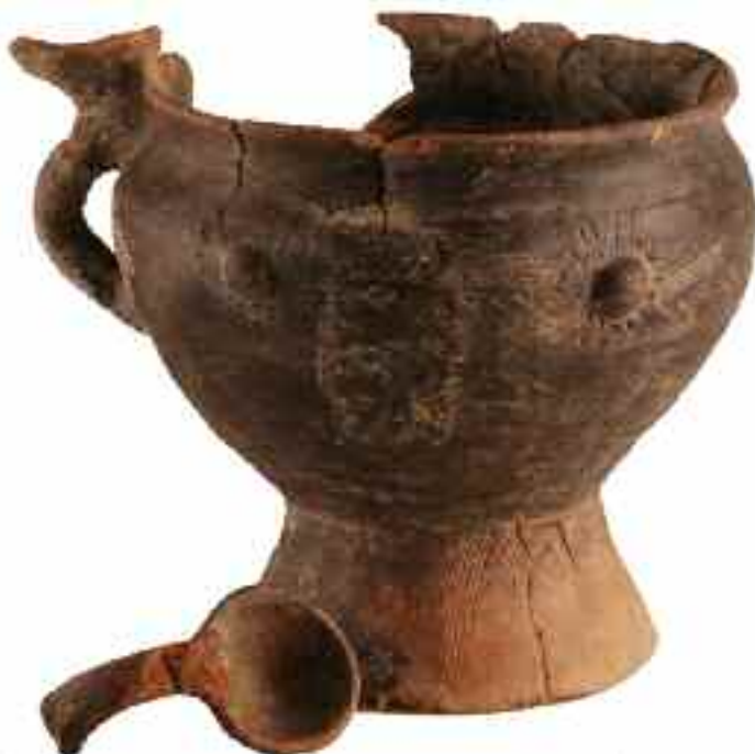
Kernos y simpulum de la tumba 174.

más esbelto, una pátera o fuente, un vaso acampanado y otro bitroncocónico de borde exvasado y pequeño pie anular de mayor tamaño que el resto, amén de una tacita y el fondo de otra cerámica recortado para ser utilizado como tapadera. Entre las cerámicas torneadas toscas se contabilizan cuatro, siendo una de ellas la urna cineraria. Finalmente, las producciones singulares cerámicas se hallan integradas por seis cajitas zoomorfas, una placa con anillas, una fusa-yola, 25 canicas de barro, dos de ellas perforadas por lo que podrían formar parte de un collar, al igual que las ocho pellitas de barro pinzadas en un extremo y perforadas, verdaderos abalorios. Aún en barro, una pieza única hasta el presente es una excepcional imitación de fibula anular hispánica que, en unión de otras piezas de imitación de orfebrería, se comentan en otro artículo de este mismo Anuario Vaccea .