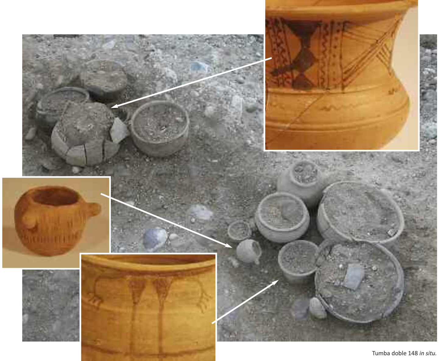
Tumba doble 148 in situ .

rendidos por la tumba 153, uno de ellos es sin duda el más hermoso documentado hasta la fecha por la exquisita asa que presenta tallada imitando la cabeza de un carnero. De la pareja de piezas aparecida en la tumba 154, en una de ellas se muestra la intención, en este caso, de imitar en el asa tal vez la cabeza de un toro a juzgar por los dos cuernos proyectados hacia delante. Vemos así una mayor variedad de intenciones de representación que la habitual del caballo señalada reiteradamente para estas cajitas.