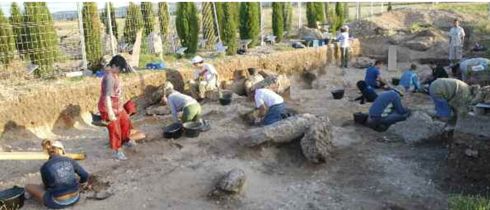
Vista general de los trabajos arqueológicos en la necrópolis de Las Ruedas.

Es preciso tener en cuenta con todo que, solo una tercera parte de las tumbas poseen una conservación buena o muy buena, y además añaden un número de piezas destacado; otros conjuntos poseen un número de piezas cuantioso aunque su conservación no ha sido muy favorable, pues muestran signos evidentes de alteración, desplazamiento o pérdidas parciales; y, finalmente, un último grupo combina una mala conservación con una presencia muy limitada de ajuar y ofrendas.