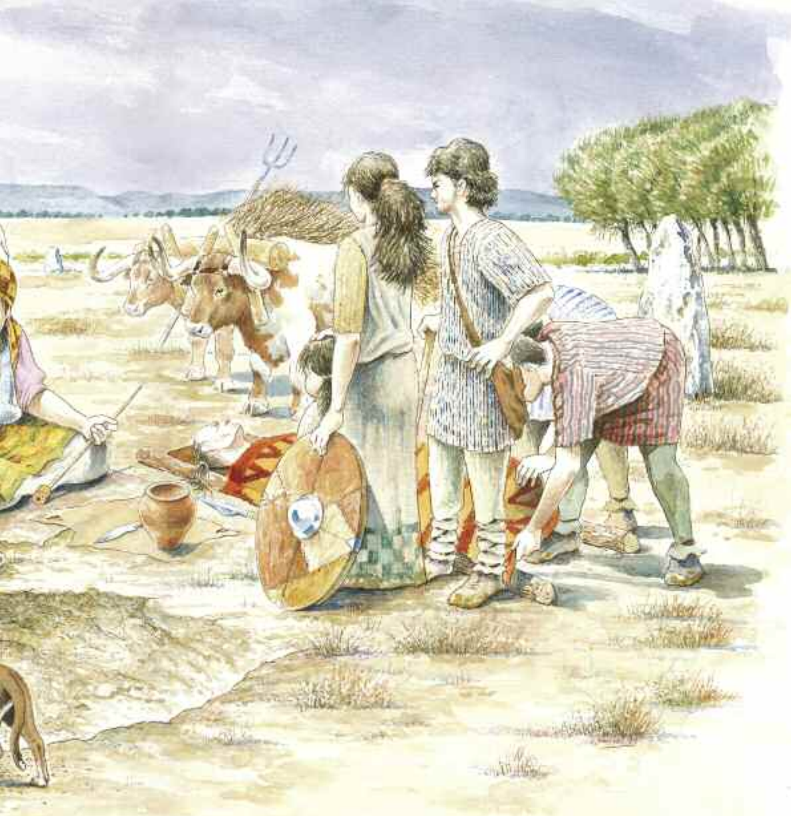
Recreación de las exequias funerarias del varón enterrado en la tumba 151 de Las Ruedas. Ilustración: Luis Pascual Repiso-CEVFW.

ticias en las tumbas 151, 153, 172 y 174, pero sobre todo en la 154 donde se han podido recuperar hasta catorce grupos individualizados de ellas.