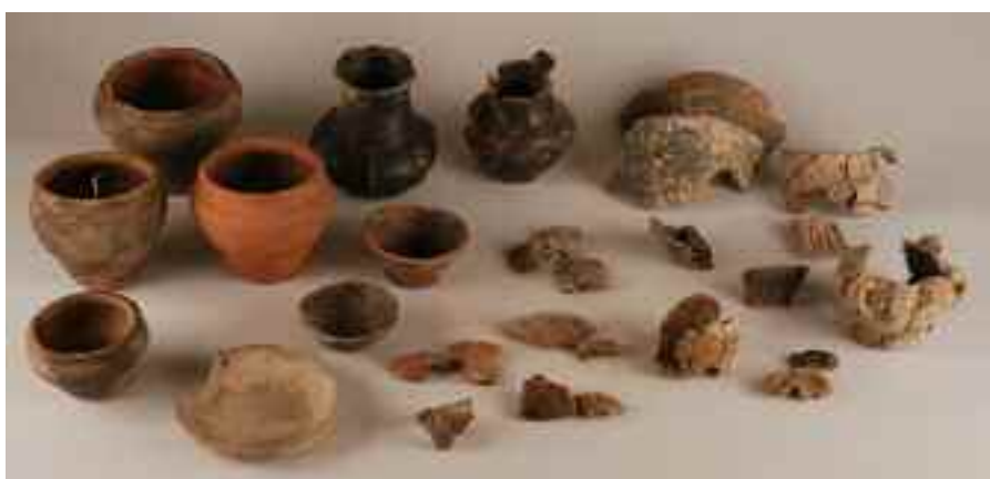
Ajuares y ofrendas de la tumba 153.