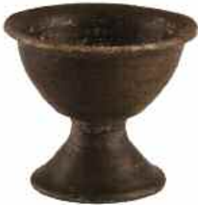
Cajita excisa con asa de cabeza de carnero de la tumba 153 y copa en cerámica negra bruñida de la tumba 173.